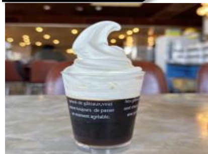
コーヒーゼリー 530 円