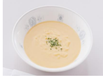
コーンスープ 400 円