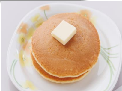
ホットケーキ 480 円