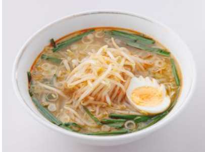
四川風塩ラーメン 630円