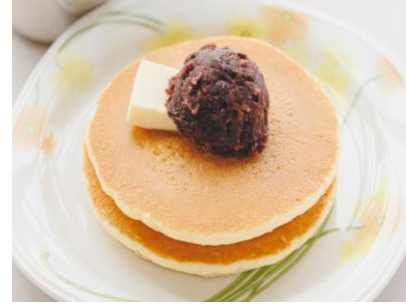
あんケーキ 580 円