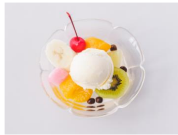
クリームみつ豆 490円