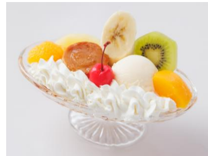
プリンアラモード 600 円