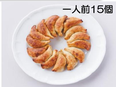
一人前 650円 二人前 1,300円