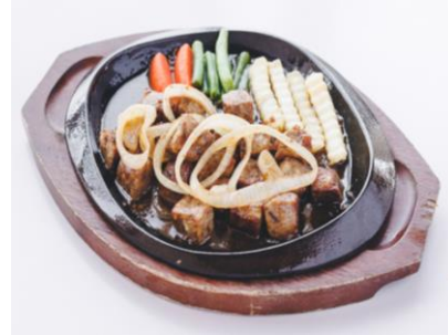
サイコロステーキ 900円