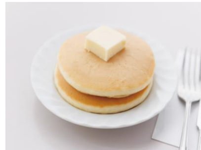
ミニケーキ 350 円