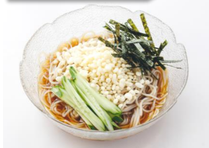
冷したぬきそば 680円