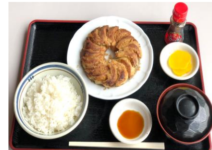
夜来香餃子定食 900円