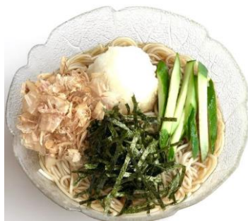
冷しおろしそば 750円