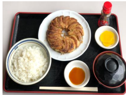
夜来香餃子定食 900円