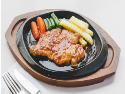
ガーリックポーク 830円