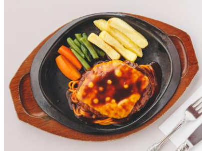
チーズハンバーグ 930円