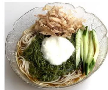
冷しめからびそば 880円