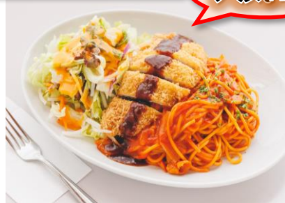
ナポリかつ 1,180円 ナポリタン 790円