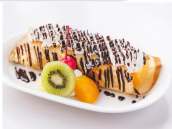
バナナクレープ 700円 お持ち帰り 750円