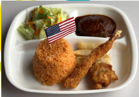
キッズプレート 750円