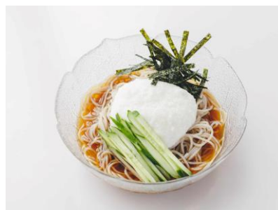
冷しとろろそば 750円