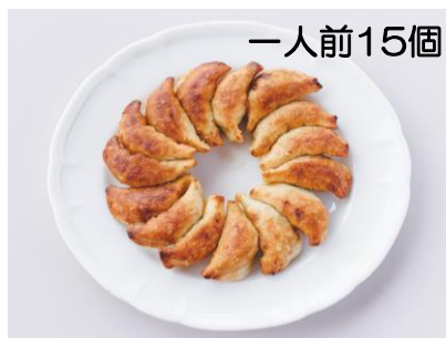
一人前15個 夜来香餃子 一人前 650円 二人前 1,300円