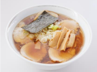
※チャーシュー麺 1000円