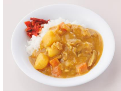
こどもカレー 300 円