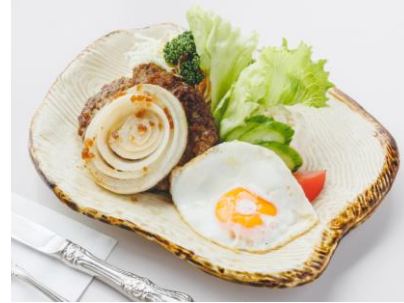
和風ハンバーグ 930円