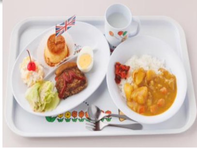
お子様ランチ 750 円