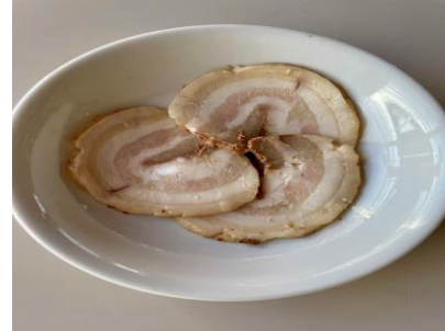
チャーシュー3枚 250円