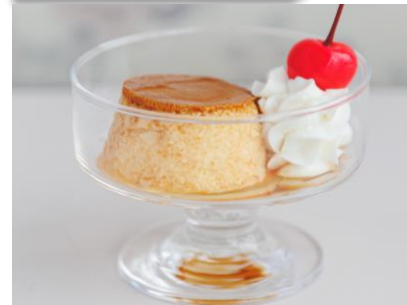
手作りプリン 250 円