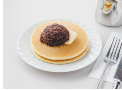
ミニあんケーキ 450 円