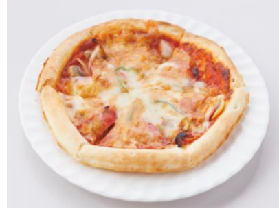
ピザ 750 円 持帰り 850 円