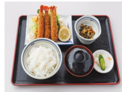
えびフライ定食 1,400円