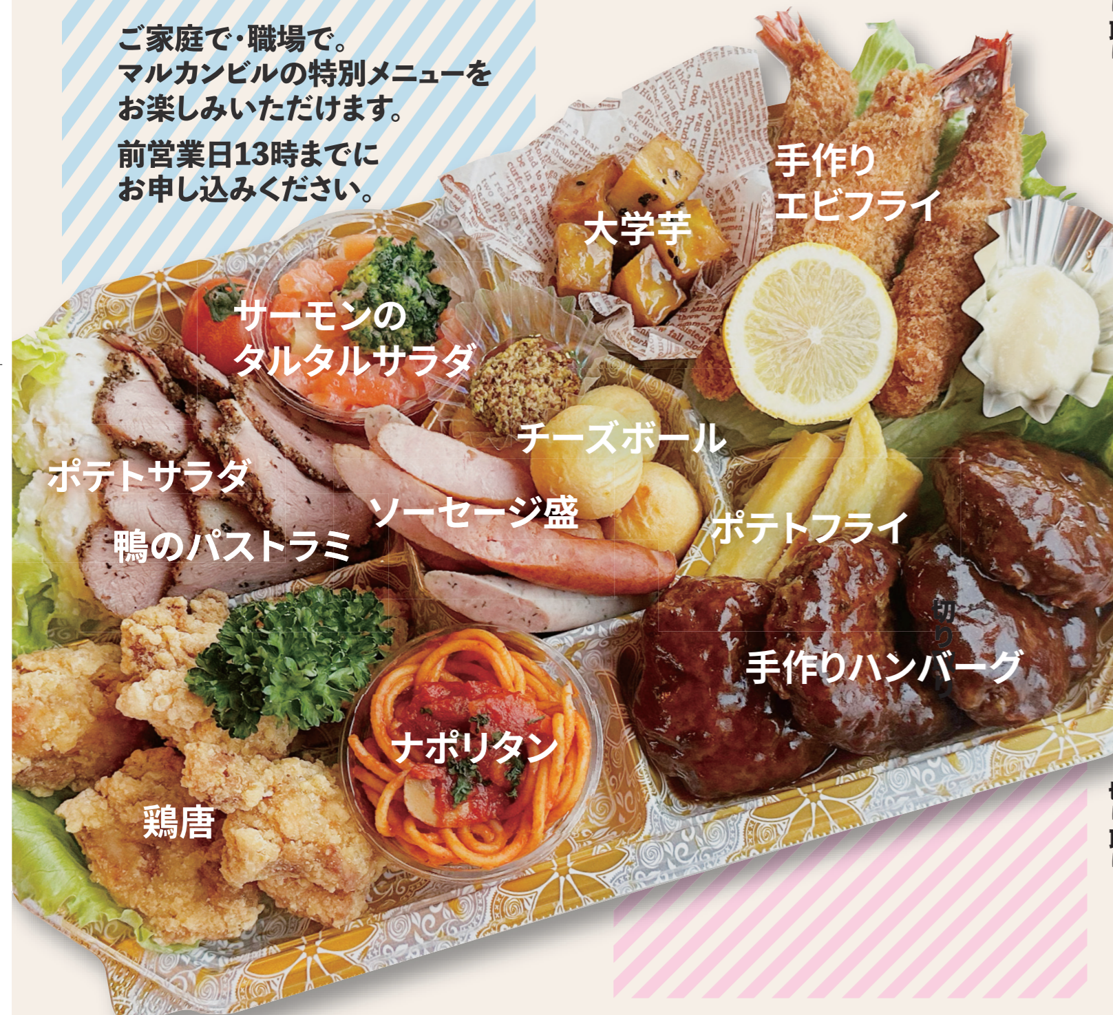
大学芋 手作りエビフライ サーモンのタルタルサラダ チーズボール ポテトサラダ ソーセージ盛 鴨のパストラミ ポテトフライ 手作りハンバーグ 鶏唐 ナポリタン

ご家庭で・職場で。 マルカシビルの特別メニューを お楽しみいただけます。 前営業日13時まで にお申し込みください。